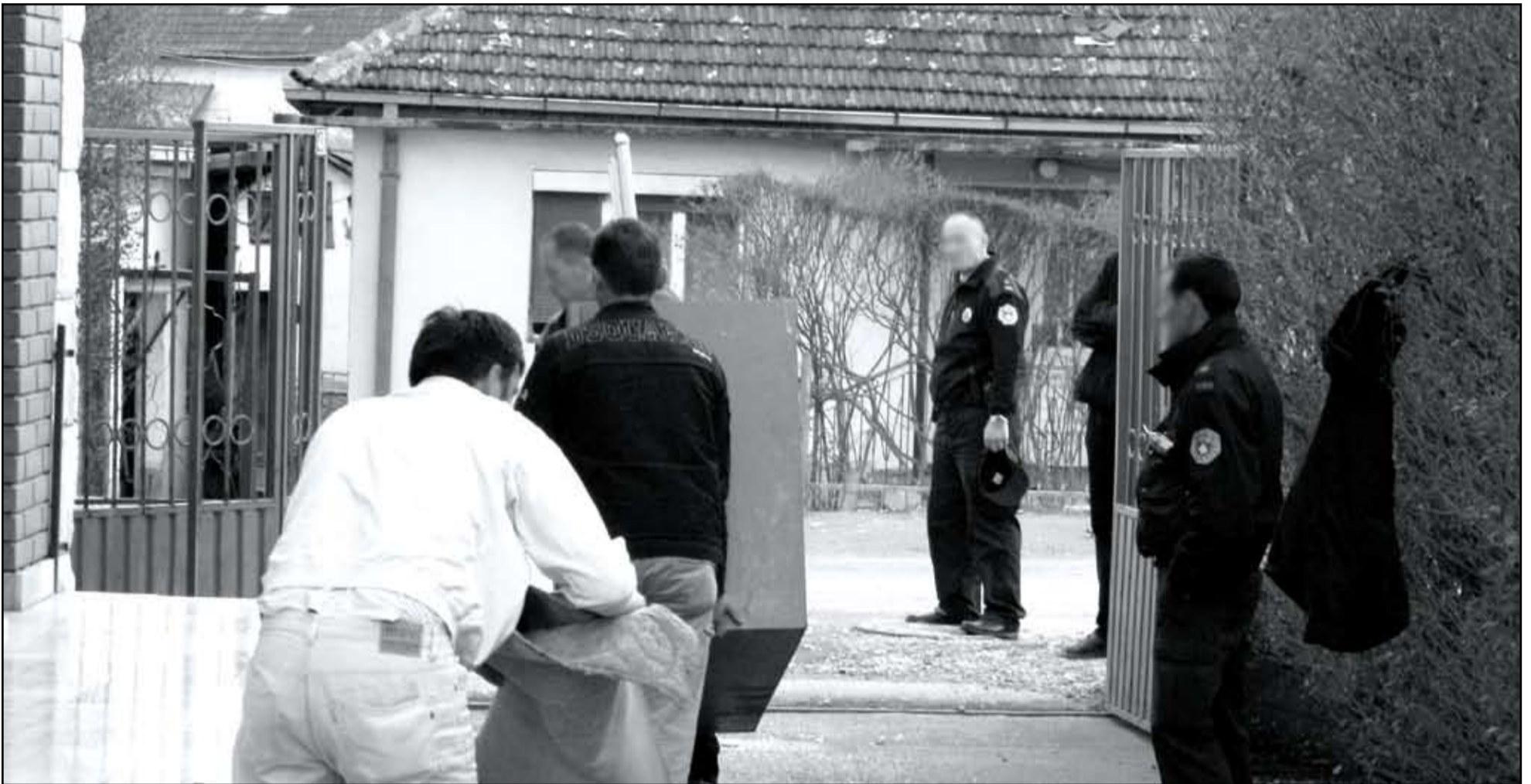
Me ndihmën e policisë, KPA-ja dëbon një uzurpator nga një shtëpi në Pejë.